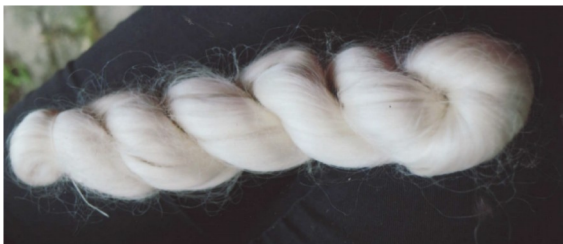
Écheveau de soie grège

Production maximum en une journée chez Swiss Silk: 800 g