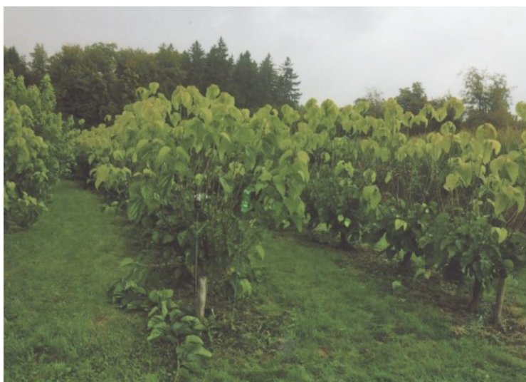
Verger de mûriers